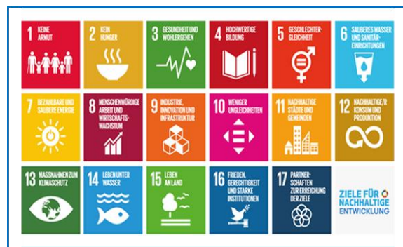
Abb. 1: Agenda 2030 - 17 Sustainable Development Goals 1

Wir am MDC erforschen die molekularen Grundlagen von Krankheit und Gesundheit und wollen Erkenntnisse möglichst rasch in die klinische Anwendung bringen. Mit unserem Forschungsprogramm „Systemweite und kardiovaskuläre Erkrankungen“ wollen wir komplexe systemische Störungen besser verstehen und neue diagnostische, präventive bzw. therapeutische Ansätze entwickeln. Somit leisten wir ganz konkret einen Beitrag zur Agenda 2030: SDG 3 -Ein gesundes Leben für alle Menschen jeden Alters gewährleisten und ihr Wohlergehen fördern . Darüber hinaus unterstützen wir in unserer alltäglichen Arbeit insbesondere die folgenden Ziele: